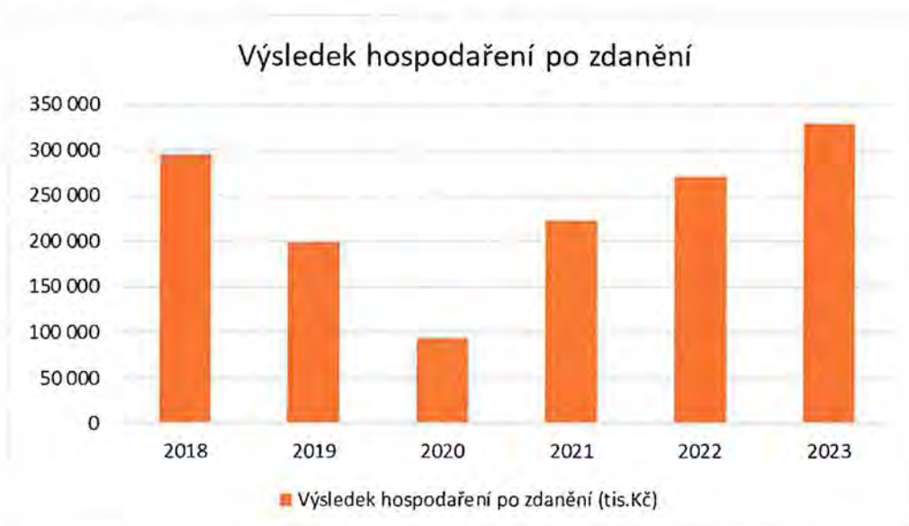
Graf č. 2: Roční výsledky hospodaření po zdanění

Meziroční srovnání vybraných ukazatelů je zobrazeno v tabulce č. 2. Z tabulky je patrný meziroční růstový trend.